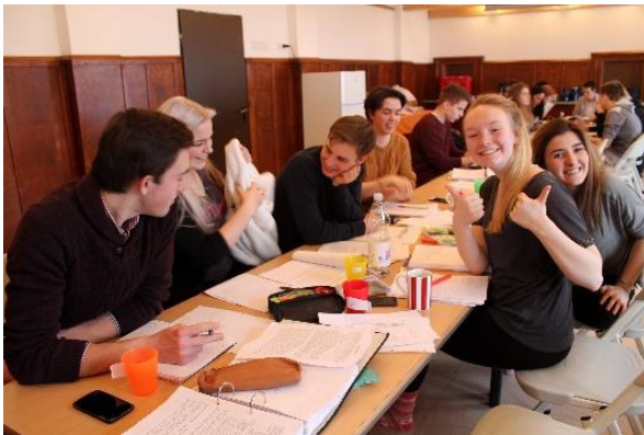
IB Schüler auf einem Arbeitswochenende