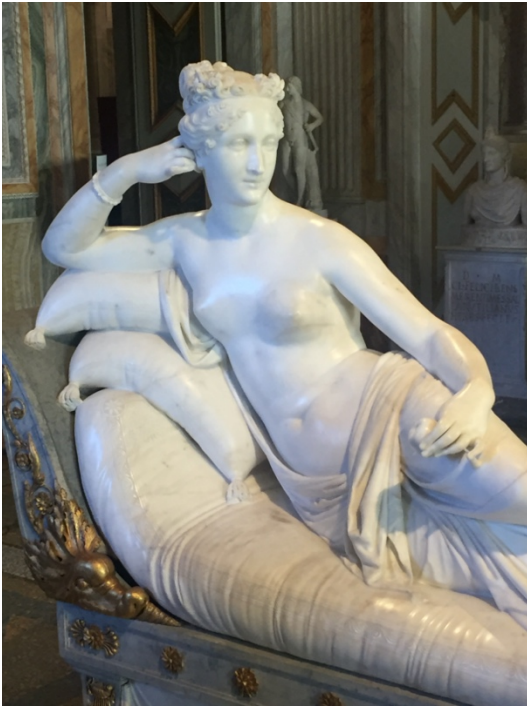
Antinio Canova, Paulina Bonaparte