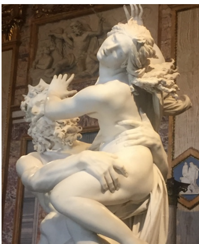
Gian Lorenzo Bernini, Hades raubt Persephone

Insbesondere die Statuen Gian Lorenzo Berninis in der Villa Borghese blieben uns als Highlight in Erinnerung.