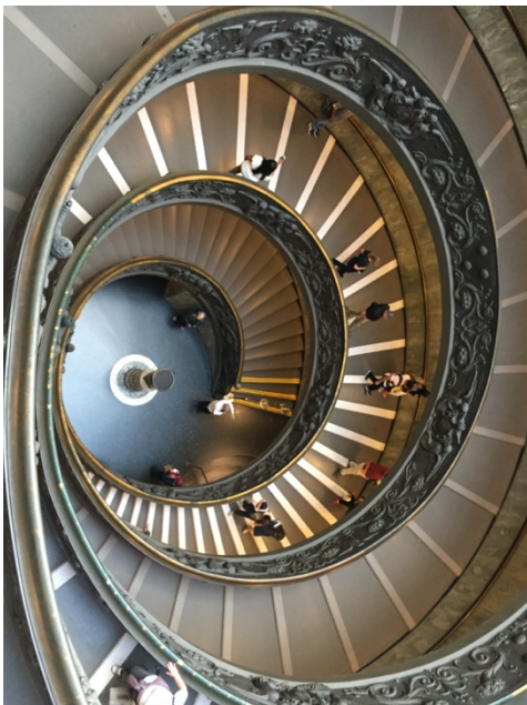
Treppe in den Vatikanischen Museen

Es führen nicht nur alle Wege nach Rom, sondern leider auch wieder hinaus.