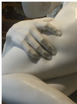
Gian Lorenzo Bernini, Hades raubt Persephone, Ausschnitt

Insbesondere die Statuen Gian Lorenzo Berninis in der Villa Borghese blieben uns als Highlight in Erinnerung.