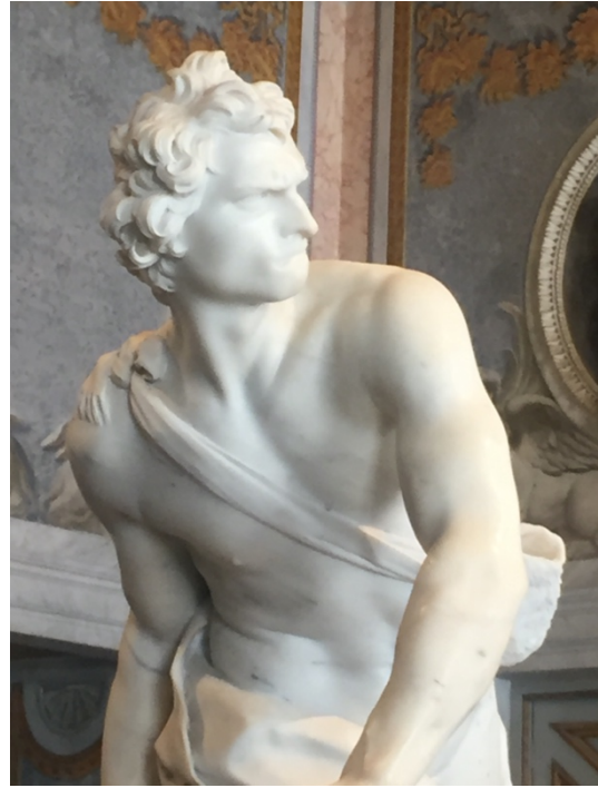
Gian Lorenzo Bernini, David

Und natürlich wurde die gesamte Speisekarte Italiens durchprobiert: Pizza, Pasta und Co gab es mittags und abends und einige aßen gar jeden Tag ein Eis. Am letzten Abend feierten wir 97,36 gelaufene Kilometer mit einem altrömischen Essen nach Rezepten des Marcus Gavius Apicius. Schließlich hatten wir gemeinsam sowohl das alte als auch das neue Rom entdeckt und mussten feststellen: