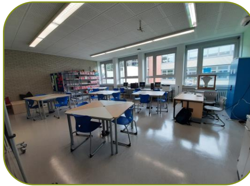
FEG, Raum A002

Am FEG wurden zwei Räume zu Lernwerkstätten umgebaut. Beide Räume haben 3 Computer mit WLAN, Regale mit frei zugänglichen Arbeitsmaterialien und Schränke mit Workshopkisten, die nach Bedarf zur Verfügung gestellt werden.