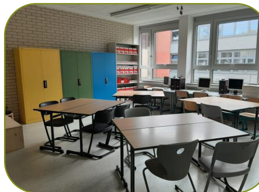
FEG, Raum A003

Am FEG wurden zwei Räume zu Lernwerkstätten umgebaut. Beide Räume haben 3 Computer mit WLAN, Regale mit frei zugänglichen Arbeitsmaterialien und Schränke mit Workshopkisten, die nach Bedarf zur Verfügung gestellt werden.