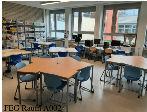
FEG Raum A002

Am FEG wurden zwei Räume zu Lernwerkstätten umgebaut. Beide Räume haben 3 Computer mit WLAN, Regale mit frei zugänglichen Arbeitsmaterialien und Schränke mit Workshopkisten, die nach Bedarf zur Verfügung gestellt werden.